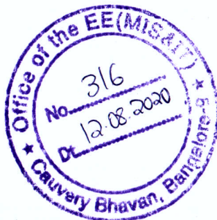
Fig. L. K. K.

ಮುಖ್ಯ ಆಡಳಿತಾಧಿಕಾರಿ ಹಾಗೂ ಕಾರ್ಯದರ್ಶಿ, ಬೆಂಗಳೂರು ಜಲಮಂಡಳಿ 10/8/2020 6/8/2020